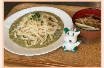
「肉汁手打ちうどん」