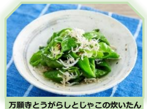
万願寺とうがらしとじゃこの炊いたん