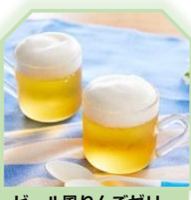
ビール風りんごゼリー