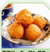
豆腐サーターアングギー