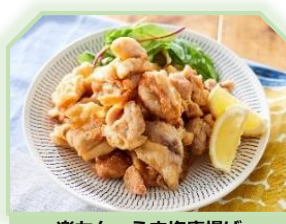
楽ちん うま塩唐揚げ