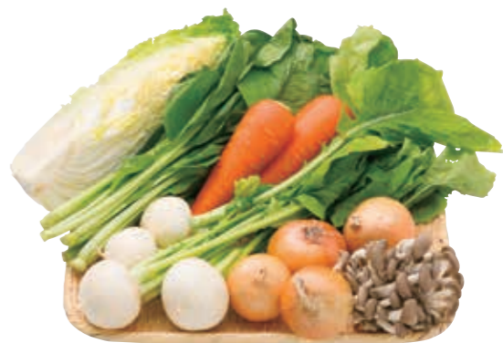
①青果は収穫と貯蔵にこだわり、新鮮に長く供給できる。